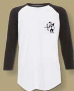
TB BASEBALL UNISEX mit kleinem TB Wappen Größen XS - XXL 28,00 €