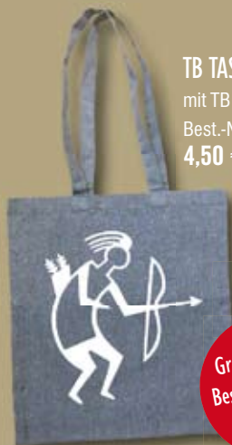
TB TASCHE mit TB Männel, grau Best.-Nr. tb-bag 4,50 €

372 farbige Seiten, 21 x 27 cm Best.-Nr. 047 48,00 €