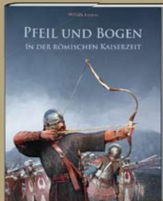
PFEIL UND BOGEN IN DER RÖMISCHEN KAISERZEIT Holger Riesch

300 farbige Seiten, 21 x 27 cm Best.-Nr. 048 44,00 €