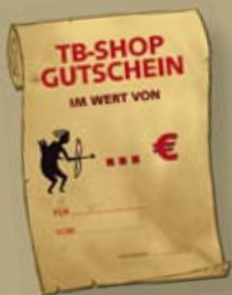
Der passt immer! TB-SHOP Geschenk-Gutschein für 10, 20, 30, 50 € oder nach Wunsch.

Gratis dazu bei Bestellungen über 100,- €