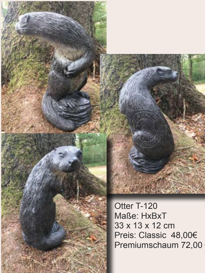
Otter T-120 Maße: HxBxT 33 x 13 x 12 cm Preis: Classic 48,00€ Premiumschaum 72,00 €

Erhältlich bei: www.franzbogen.de oder www.bad-wolf-company.de