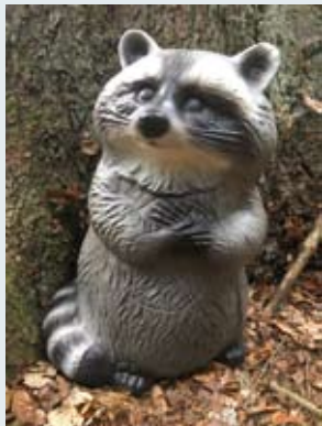
Waschbär T-160 Maße: HxBxT 42 x 26 x 22 cm Preis: Classic 84,00 €

3D-Tiere für Blasrohrschützen und Bogensport