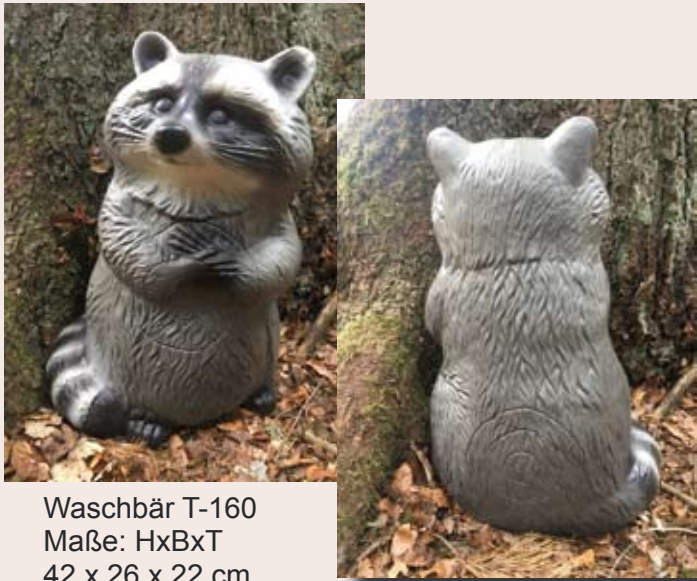
Waschbär T-160 Maße: HxBxT 42 x 26 x 22 cm Preis: Classic 84,00 € Premiumschaum 126,00 €

Die Firma Franzbogen hat 2 neue 3D - Tiere der Gruppe 4 auf den Markt gebracht.