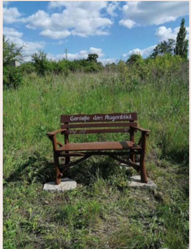
Die Bank lädt zu einer schönen Aussicht ein