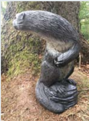
Otter T-120 Maße: HxBxT 33 x 13 x 12 cm Preis: Classic 48,00€