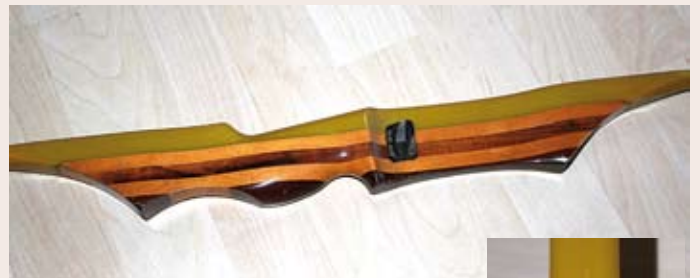
Fotos: Wings Griffstück / Wings Logo

Ähnliche Griffstück wurden auch an Wings Bögen aus Hickory verbaut.