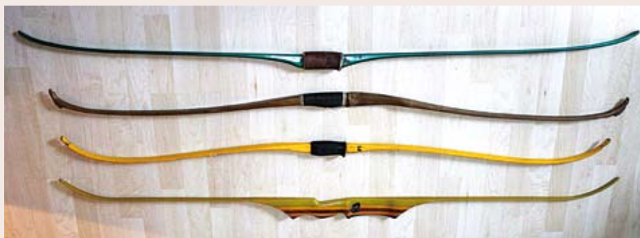
Foto: Verschiedene Fiberglasbögen

Auch heute noch werden Bögen aus verschiedenen Kunststoffen, bzw. Fiberglas hergestellt. An sich müsste hierfür sogar eine weitere Klasse im TBVD geschaffen werden, genau wie auch für Bögen aus Stahl oder Metall. Da aber die Zahl der Schützen, die solche Bögen schießen gering ist, werde ich wohl keinen Antrag dafür einreichen. Anders war das insbesondere in der Mitte der 50er Jahre des letzten Jahrhunderts, wo reine Holzbögen, neben Bögen aus Carbonstahl, glasbelegte Bögen und Vollfiberglasbögen, sowie damals noch (in der westlichen Welt) vollkommen exotische Compositbögen existierten.