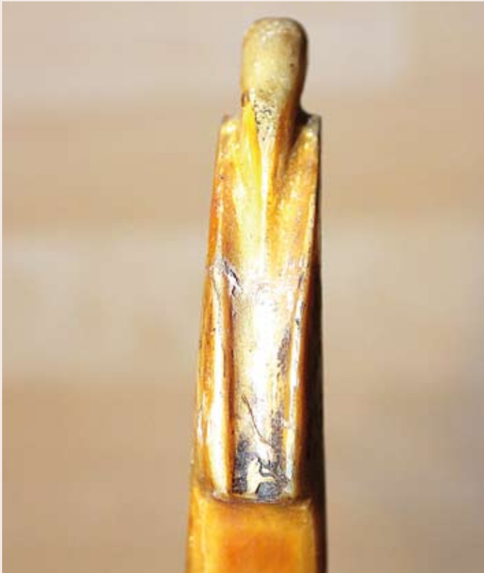
Fotos: Details Indian Archery

Der hier gezeigte Bogen hat eine Länge von etwa 62" und ein Zuggewicht von ca. 60# Es ist ein Rechtshandbogen mit einer Ledergriffwicklung und weiteren Zierwicklungen. Die Tips sind wie kleine Holzrecurves ausgearbeitet und haben auf der Bauchseite eine Führungsrille für die Sehne.